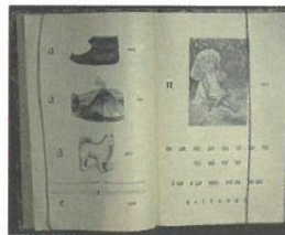
ABC-bok, Abbis-kirje, Sami Manaita, 1906.