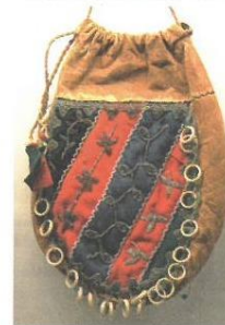
Väska i renskinn, 1920.