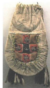
Väska i renskinn, 1820.