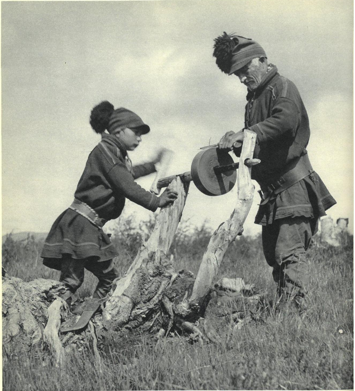
72 The knife must be kept sharp.