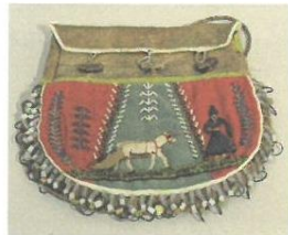
Väska med pärlbroderi, 1900.