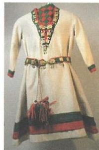
Kvinnokolt (sydsamisk), 1900.